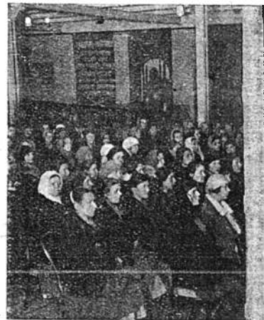
Собрание на фабрике «Красный Богатырь», слушает доклад о проекте постановления СНК.

НА ПРЕДПРИЯТИЯХ „ГОНЕЦ“ И „СПАРТАК“ ЗА ПРОЕКТ ГОЛОСОВАЛИ 1000 ТРУДЯЩИХСЯ, В КИНО „ФОРУМ“ — 2000 ДОМАШНИХ ХОЗЯЕК, ГЛАВНЫМ ОБРАЗОМ ЖЕН РАБОЧИХ — 24, 25, 31 и 48 ОТД. МИЛ'ЦИИ.