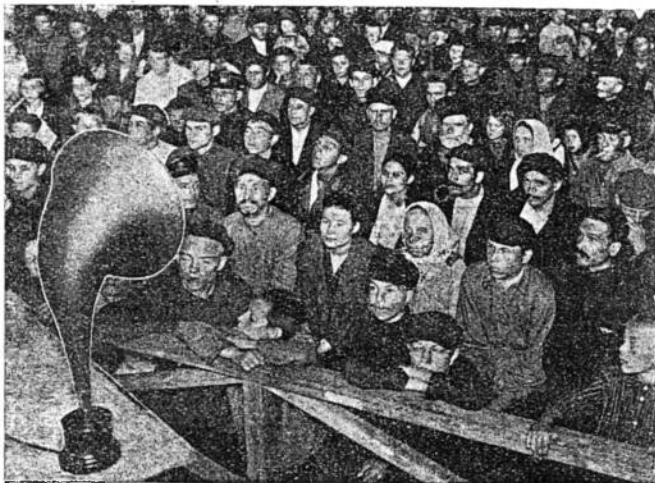
В летнем клубе на б. цинделевской фабрике слушают радио

ДУМЛЕВ (Минск) сообщает о громадных размерах пьянства среди железнодорожников. Пьянство срывает работу в клубе, пьяные хулиганят и не пропускают девушек, подстерегая их у входа в клуб. Пьянство и хулиганство надо истреблять.