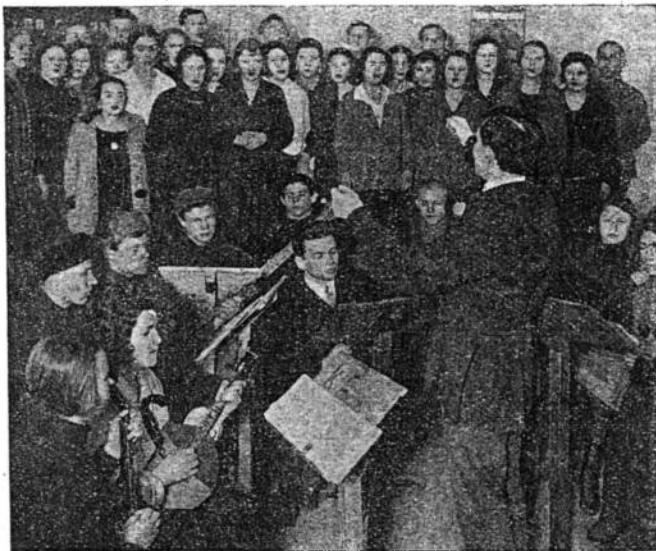
Музыкальный кружок завода Авиахима (Москва)

Клубные работники, — призывает тов. Семашко, — должны поставить борьбу с алкоголизмом в угол своей работы.]