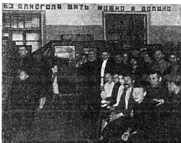
Антиалкогольная выставка в клубе «Октябрьской революции».

На периферии: в мастерских, депо и цехах проводились беседы, выставки и обсуждался проект декрета.