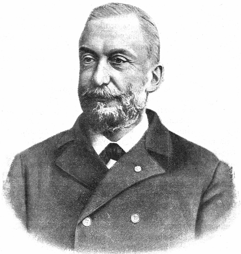
Профессоръ А. Форель.

Конечно, самое худшее зло—это физическое и умственное вырожденіе потомства алкоголиковъ, происходящее отъ непосредственнаго дѣйствія этого яда на сперму и половыя железы пьющихъ мужчинъ и женщинъ. Сперма-